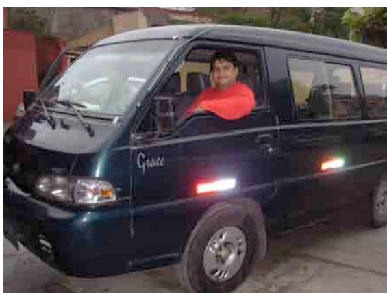
La nouvelle camionnette de Kallpa, achetée grâce aux dons des membres d'AKG

L'association Kallpa-Genève a été sollicitée l'automne dernier pour appuyer Kallpa Pérou dans l'achat d'une nouvelle camionnette pour effectuer les nombreuses visites sur le terrain. Le comité a donc décidé de soutenir cet achat avec un don de 10'000 dollars en 2008 qui a permis à notre partenaire, au début de cette année, de faire l'achat d'une camionnette pour assurer les déplacements.